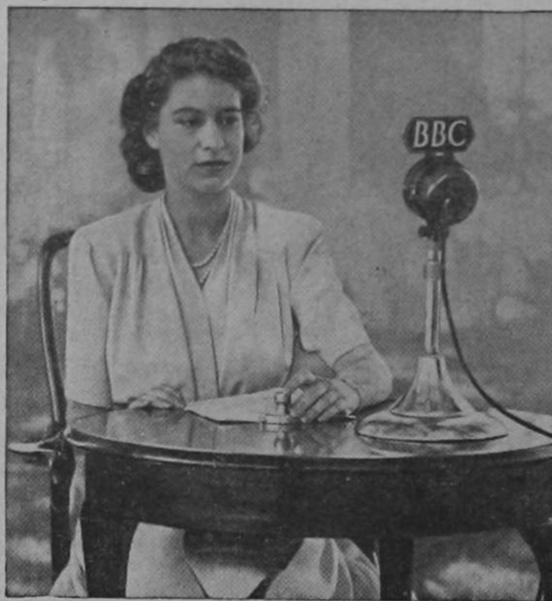
LA PRINCESA LOCUTORA

Tiene la princesa gran tenacidad de carácter, por lo que no abandona ninguna de las empresas que