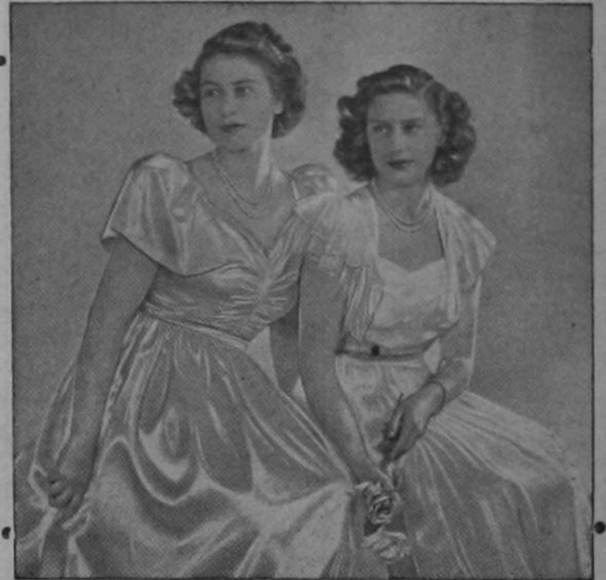
LA PRINCESA EN EL HOGAR

Sencilla, comprensiva, enérgica, tenaz, de buen humor y amable, tiene la princesa las cualidades de que participan también miles de jóvenes