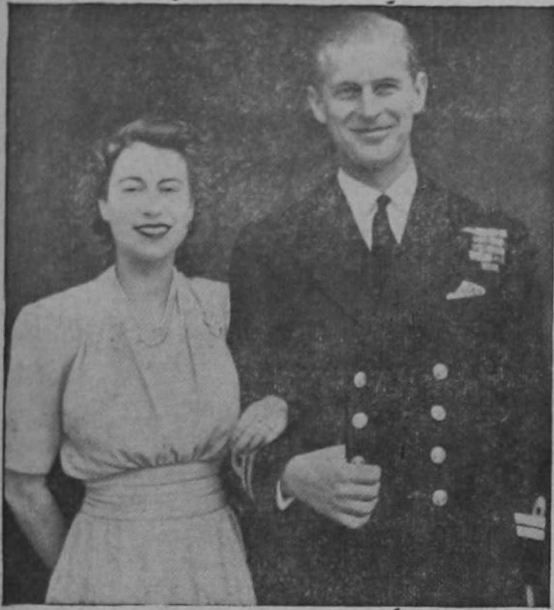
LA PRINCESA PROMETIDA

Al lado de su novio Felipe Mountbatten (ex-Príncipe Felipe de Grecia) la joven Princesa Real de la Gran Bretaña, Elizabeth.